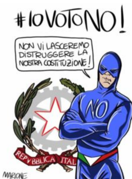
Vignetta di Marione ( facebook.com/marionecomix/ )

#BastaUnSi e la riforma della Costituzione sarà operativa. Ma dove nasce questa riforma? Una cronologia per capire perché #IoVotoNo.