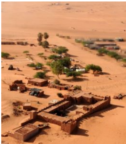
Militari italiani in Niger – fort Madama

L'annuncio di fine anno 2017: "Inviamo militari italiani in Niger per contrastare il traffico degli esseri umani e il terrorismo". Ma davvero? E l'uranio francese non c'entra nulla?