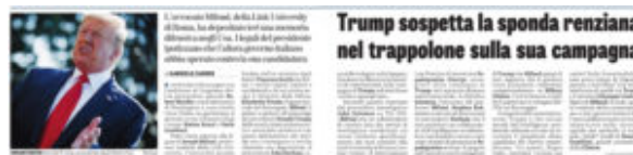
La Verità – 3 Agosto 2019

Contro cui tutti gli altri sembrano allenarsi per il “tiro al piccione”, peraltro (click per ingrandire)